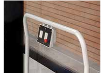
Pulsantiera di bordo Steppy

Steppy è leader tra le piattaforme elevatrici per le soluzioni tecniche ed estetiche di prim'ordine; con meccanica idraulica, protezioni in metallo o policarbonato fumé per migliorarne il design e l'impatto estetico, comandi di bordo, a muro e con radiocomando.