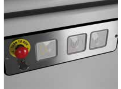
Pulsantiera di bordo Silver

Versione standard in acciaio verniciato, RAL 7040