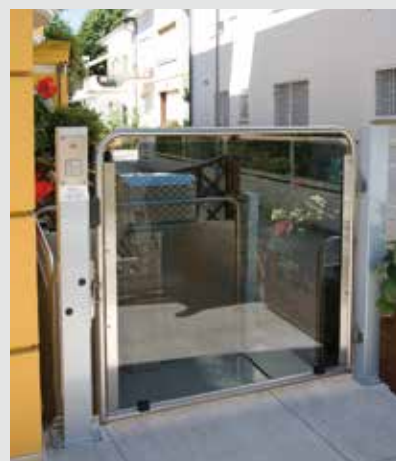
Silver in versione INOX (optional)