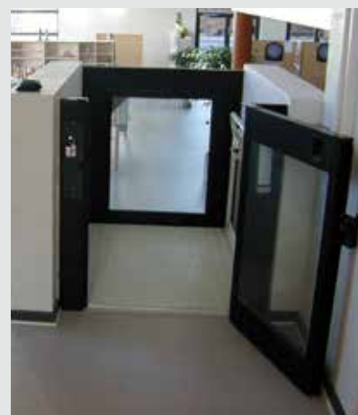
Steppy con porte e cancelletti automatici