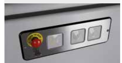
Pulsantiera di bordo completa di chiave per abilitazione chiamata.

Si adatta perfettamente alle esigenze funzionali ed estetiche. Necessita di una fossa minimale (0-145 mm), quindi l'installazione è davvero su misura delle strutture pre-esistenti.