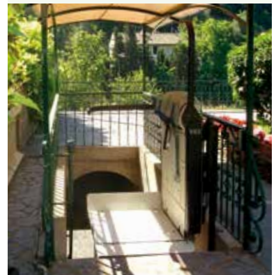
V65 con barre indipendenti