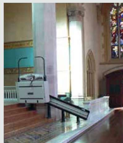
V64 con ribaltamento pedana automatizzato