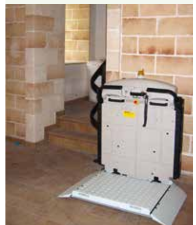
V65 con barre retrattili