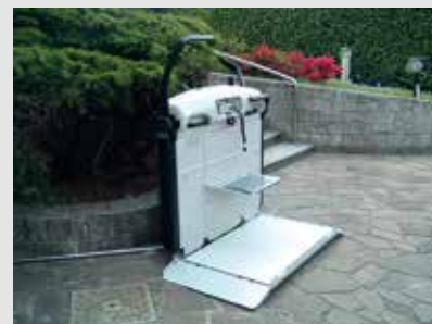
V65 con sedile